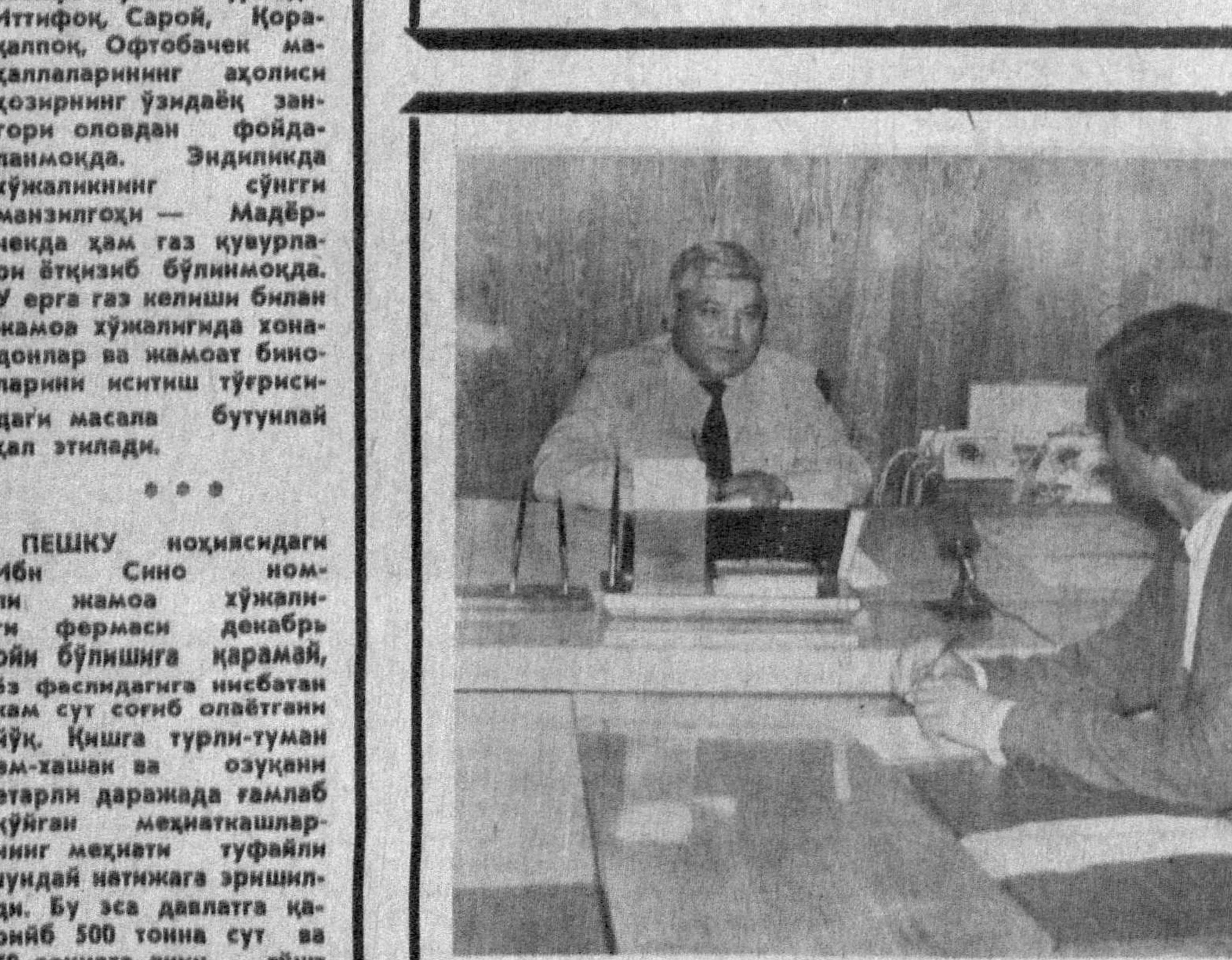
ПЕШКУ ноҳиясидаги ИБН Сино номи жамоа хўжалиги фермаси декабрь ойи бўлишига қарамай, 63 фазилдагига нисбатан кам сут соғиб олаётгани йўқ. Қишга турли-туман оғ-ташак ва озунани етарли даражада тамлаб қўйган меҳнатқилларнинг меҳнати тўғрисида шундай натижага эришилди. Бу эса давлатга қарийб 500 тонна сут ва 70 тоннага яқин гўшт сотиш имконини берди. Озуқа ченда молларни боқиш учун ҳар эҳтимолга қарин кўлаб ел-хашак тамлаб қўйилган. Чорвачилик биононлар реломондан чиқарилади, иситилди, жамоа хўжалиги биононлари сут-товар фермасининг моллар туғдиган бўлишида яқиниқс қут билан иш-падилар.

«Иттифоққа кирган республикалар ўз ҳуқуқларининг бир қисмини унга беради», дейилади. Кичкина, катта-ми, ўз ҳуқуқини бирова берган давлат тўла лаёқатли бўла оладими? Йўқ, албатта. «Иттифоққа кирган давлатлар билан бўлган келишмовчиликлар Иттифоқ Олий суди томонидан ўзин-қисил ҳел қилинади» деб белгиланади. Иттифоқ Олий суди кимга хизмат қилиши маълум-ку!