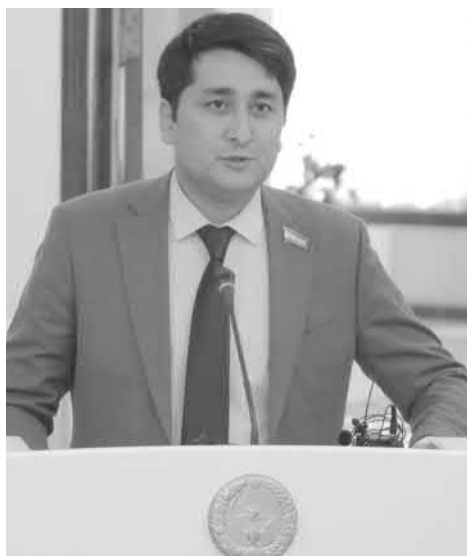
Фирдавс ШАРИПОВ, Олий Мажлис Қонунчилик палатасидаги ЎЗХДП фракцияси аъзоси:

Энди йил якунигача одамларга протез воситаларини бериш, нафақа ва қаровсиз қолган болаларга васийликни расмийлаштириш, ўзгалар парваришига муҳтож кексаларни ёлғиз, деб эътироф этиш каби 49 та ижтимоий хизмат маҳаллага таъминлашга таъминлаётган миқдорнинг кўпайишига қўлдош беришнинг аниқлиги ҳақиқий аъзоси, деб ҳис қилсин. Ҳаммамиз шунга интилишимиз зарур.