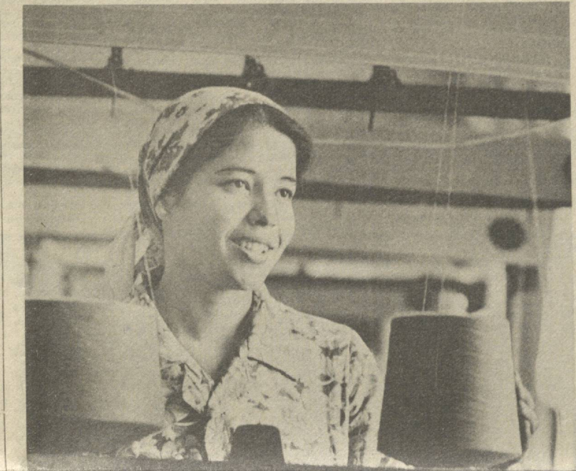
Кенг истеъмоли буюмлари—халққа ҒОЛИБЛАР САФИДА

Бригадамиз бинокорлари шанбалик ўтказилиши ҳақидаги хушхабарни қизғин маъқуллаб, кўтаринки кайфиятда кутиб олдилар.