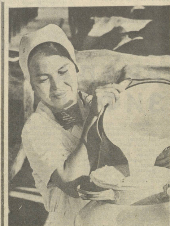
ТОШКЕНТ. Бекобод гўшт комбинати ёрдამчи хўжалиги коллективни мамлакат Осиё оҳақот программасининг муваффақиятли бажарилишига...

Зий Комитети Халқаро бўлими муҳридорини ўринбосари В. С. Шапошников қатнашмоқда.