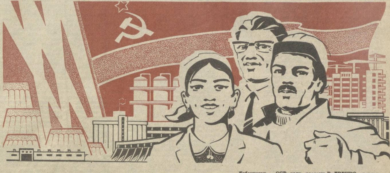
Ўзбекистон ССР халқ rassоми В. ЕВЕНКО плакати.