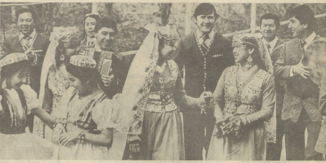
Тошкент область, Оржоникидзе районидagi «Қизил Ўзбекистон» колхозининг «Дўстлик тароналари» ашула ва рақс ансамбли республикамиз халқаролик сўнгашининг тажрибали коллективларидан саналади. Ўз саҳида олтиндан зиёд халқ талантини уюштирган ансамбль репертуаридан партия, Ватан, Дўстлик, меҳнат ва муҳаббатни таранаму этувчи куй ҳамда қўшиқлар ўрин олган.

Чет мамлакатлар билан дўстлик ва маданий алоқа Ўзбекистон жамияти президиумининг раиси.