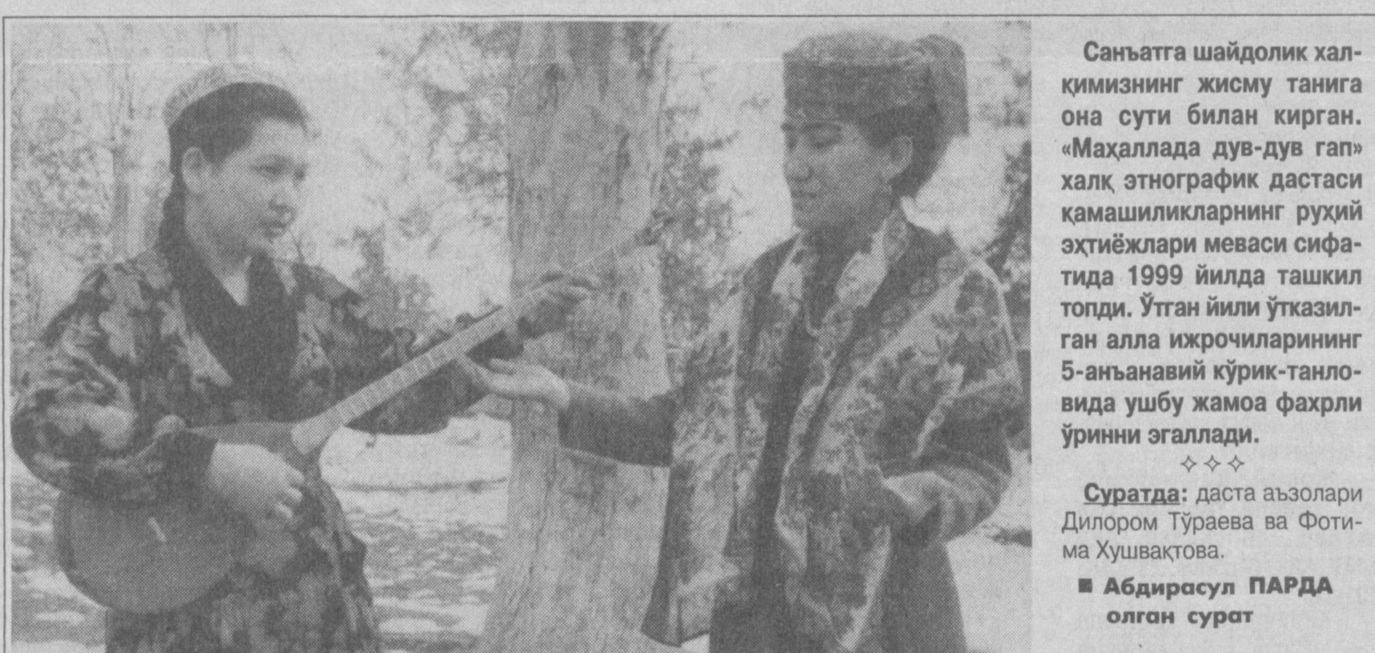
Санъатта шайдолик халқимизнинг жисму танига она сутти билан кирган. «Маҳаллада дув-дув гап» халқ этнографик дастаси қамшиликларнинг руҳий эҳтиёжлари меваси сифатида 1999 йилда ташкил топди. Ўтган йили ўтказилган алла ижрочиларнинг 5-анъанавий кўрик-танловида ушбу жамоа фахрли ўринни эгаллади.

■ Алишер ИБДОДИНОВ, «Ўзбекистон овози» мухбири