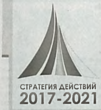
СТРАТЕГИЯ ДЕЙСТВИЙ 2017-2021