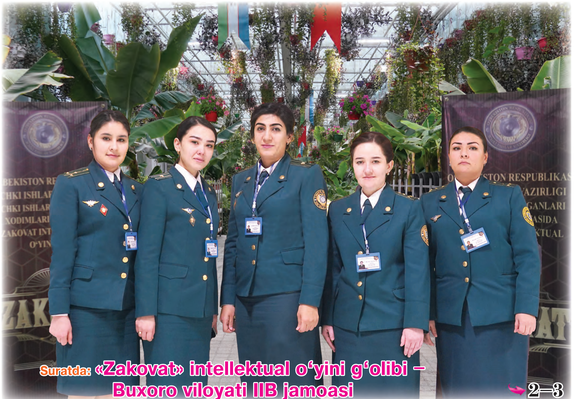
Suratda: «Zakat» intellektual o'yini g'olibi – Buxoro viloyati IIB jamoasi

Buxoro shahrida ichki ishlar organlari xotin-qizlari III respublika forumi bo'lib o'tdi