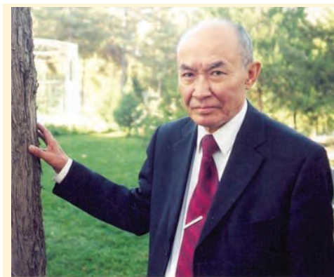
Abdulla ORIQOV, O'zbekiston Qahramoni, xalq shoiri.