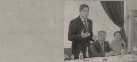
Давоми. Бошланғич 1-бетда.

■ ЎЗБЕКISTON ХДП ТОМОНIDAN ЖОЙ-ЛАРДА ЎТКАЗИЛАЁТГАН ТАДБИРЛАР ЗАМОНАВИЙ УСУЛЛАРДА УЎШТИРИЛ-МОҚДА, ҚУРУҚ МАЪРУЗАЛАР ЎРНИГА КўПРОҚ ЖОНЛИ, ИНТЕРФАОЛ МАШҒУЛОТЛАР ТАШКИЛ ЭТИЛМОҚДА.