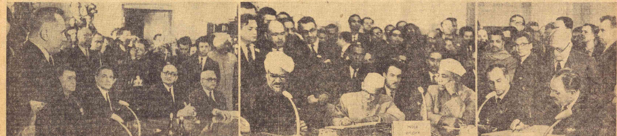
Биринчи суратда (чапдан): СССР Министрлар Советининг Раиси А. Н. Косигин сўзламоқда; иккинчи суратда: Ҳиндистон Бош Министри Лаъл Баҳодир Шастри ва учинчи суратда Покистон Президенти Муҳаммад Аюбхон Тошкент Декларациясини имзоламоқдалар.