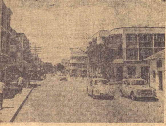
Танзания пойтахти Доруссалом. Суратда: Озодлик кўчаси.

Меҳнаткашларнинг франкочил- ларга қарши олиб борган кураши натижасида вужудга келган ишчи комиссиялари фаланг синдикатла- рига қарши туровчи қасаба союз ташкилотларига айланди. Уларнинг эътибори ҳамда меҳнаткаш омма ўртасидан таъсири шунчалик ор- тиб кетдики, улар ҳокимият томо- нидан расман танлимаган бўлса ҳам, забастовкалар даврида қочо- нга ағдарили улар билан ҳисобла- шнига мажбур бўлишди. Холиқнинг Унадабей район, вило- ят ва тармоқлар бўйича ва умум- миаллий комиссиялар тузилди. Мед-