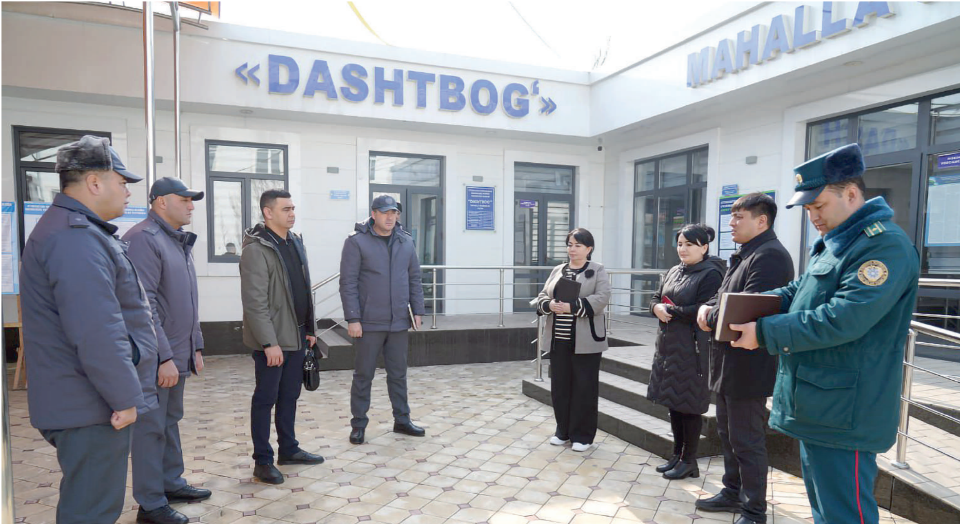
Ўтган йили содир этилган 11 та жиноятчилик ҳолатининг 6 таси ўғирлик, 2 таси енгил ҳамда ўрта тан жароҳат, алимент, маиший зўравонлик жинояти бўлиб, уларда қонун устуворлиги таъминланди.