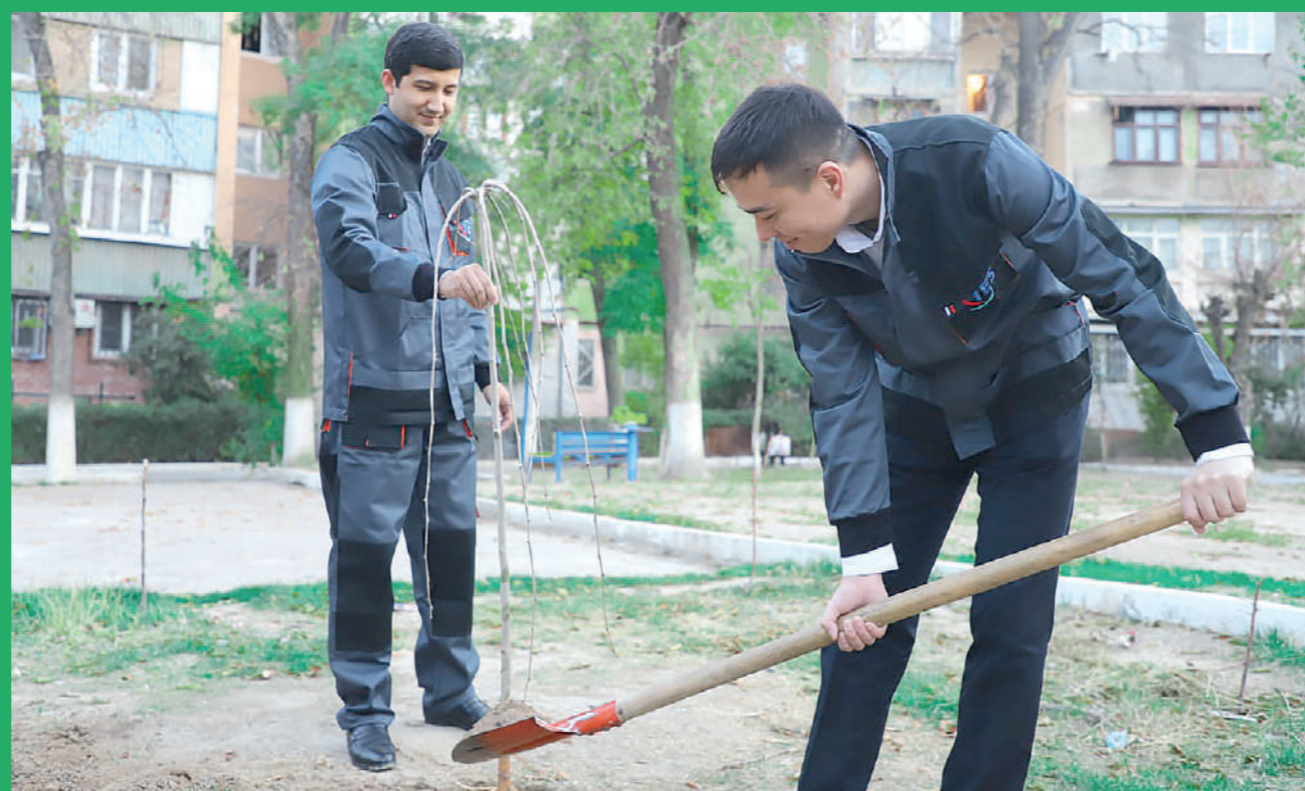
“Маҳалламга 10 тул дарахт — менинг туҳфам” акцияси ўтказилади.

Вазирлар Маҳкамаси фармойишига кўра, 2024 йил 16-18 март кунлари ана шу шиор остида юртимиз маҳаллаларида умумхалқ хайрия ҳашари ўтказилади