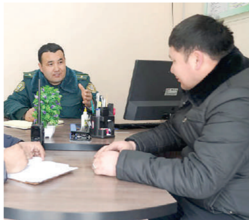
Жиноятнинг олдини олиш мақсадида маҳалланинг асосий кириш кўчаларига, йўл бўйларига, муҳим объектларга 300 дан ортиқ кузатув камералари ўрнатилди.

Аввало, жиноятнинг олдини олиш мақсадида маҳалланинг асосий кириш кўчаларига, йўл бўйларига, муҳим объектларга 300 дан ортиқ кузатув камералари ўрнатилди. Уларнинг 30 таси хизмат хонамга интеграция