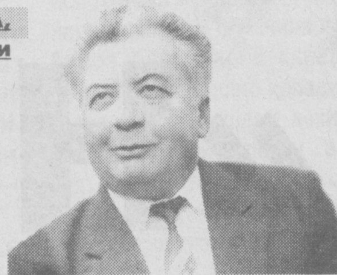
Ҳабиб САЪДУЛЛА, Ўзбекистон халқ шоири