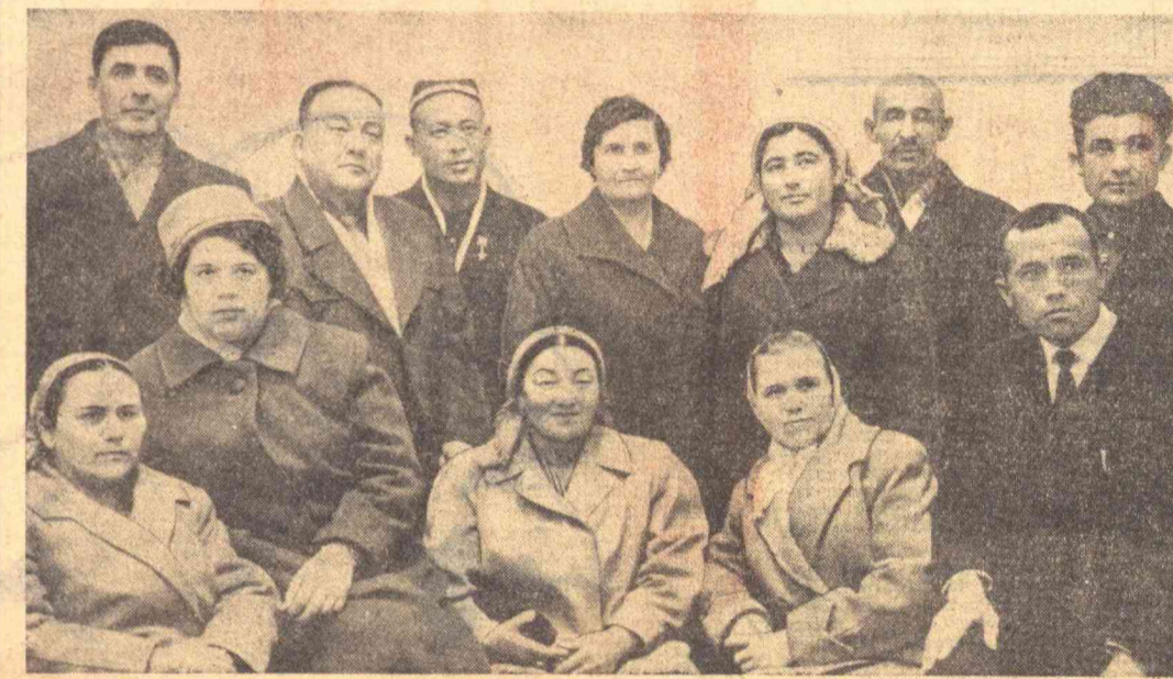
КПСС XXIII съезди делегатларидан бир гуруҳини суратда...