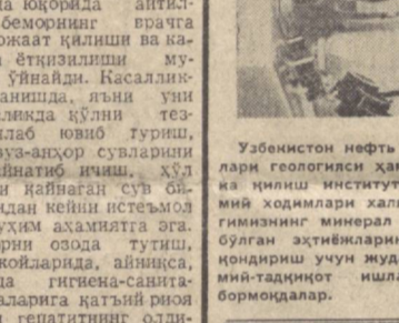
Ўзбекистон нефть ва газ кон- лари геологисини ҳақида развед- ка қилиш институтининг ил- гимий ходимлари халқ ҳўжалиқ- нинг минерал қон ашба бўлган экинчиларнинг тўлароқ қондириш учун жууда катта ил- мий-тадқиқот ишлари олиб бормоқдалар.