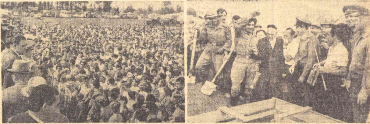
Кеча Сергели посёлкасида қатна митинг бўлди. Суратларда: (чапда) Тошкентнинг йўлдоши — Халқлар дўстлиги шаҳри қурилишига бағишланган митинг; (ўнгда) биринчи уй пойдеворида эсдалик хати солинган идишни қўйиш пайти.

Раиси Нородон Кантол шонли сана муносабати билан СССР Олий Совети Президиумининг Раиси Н. Подгорнийга ва СССР Министралар Советининг Раиси А. Косигинга қизғин кутловлар изҳор этидилар. (ТАСС).