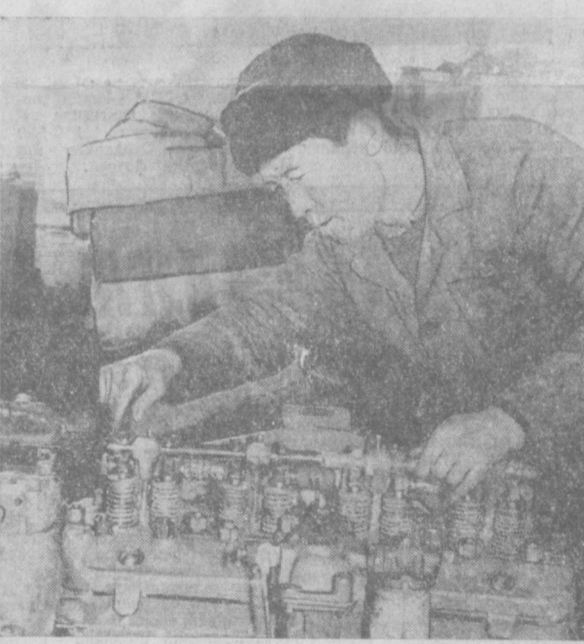
„УЗСЕЛЬХОЗТЕХНИКА“ Бўстонлиқ район бўлими устаносида тракторлар ремонтини жадал олиб боришмоқда.

Бу меҳнатсеварларга «Энг яхши комсомол-ёшлар бригадаси» номи берилди.