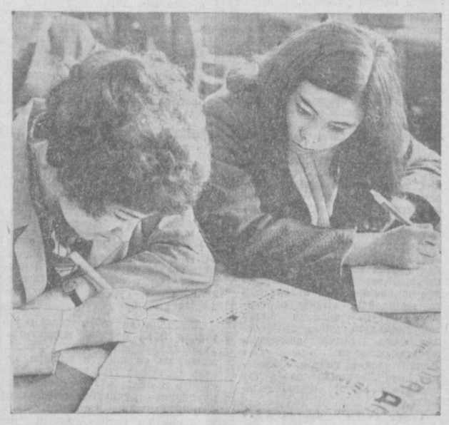
Туққизинчи беш йилликнинг улдувур вазифалари совет кишилари ғайратига-ғайрат, кучига-куч қўшмоқда.

Коммунистик партия биз — совет кишиларини ҳамма вақт улдувур вазифаларини бажаришга, коммунизм мўл-қўлигини вужудга келтиришга, халқ фаровонлигини яратишга сафарбар этиб келмоқда.