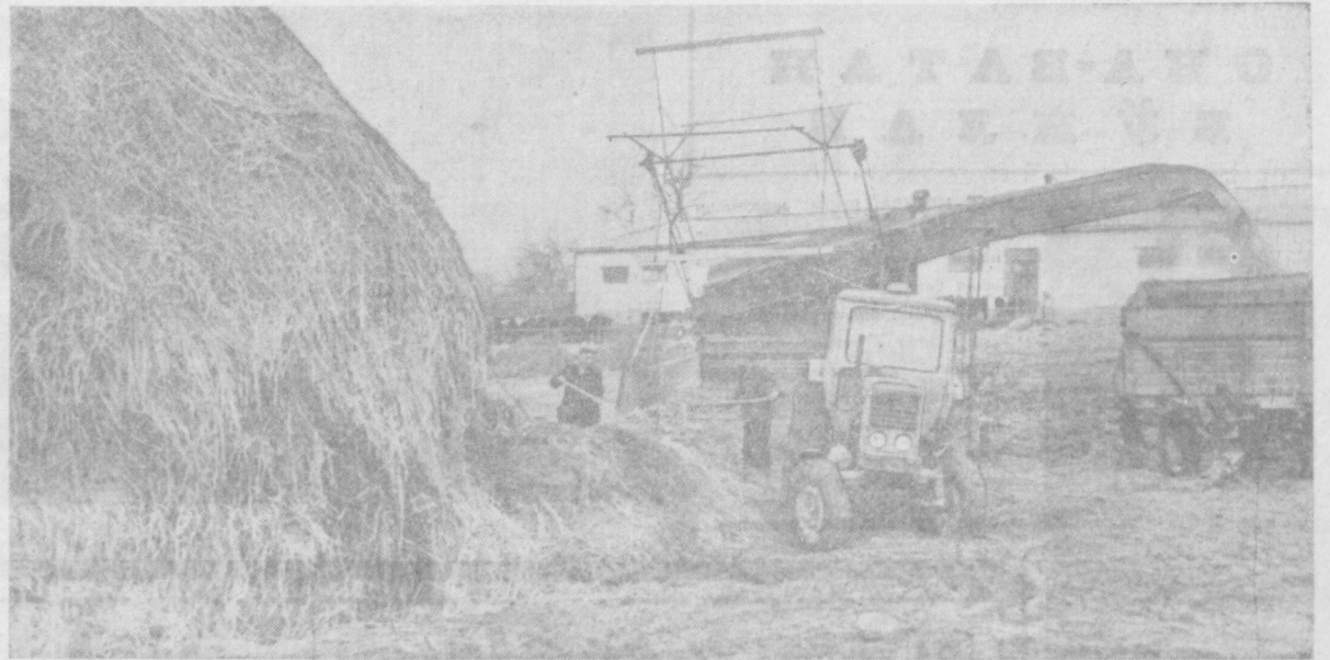
КАЛИНИН РАЙОНИДАГИ Илтиф номли қолхозда чорва молларини боқиб яхши йўлга қўйилган. Қолхозчилар ем-ҳашани мўл-кўл жамгарганликлари сабабли чорва қишлови муваффақиятга эришди. Суратда: дағал хашани молларга беришдан олдин меҳнатчилар ёрдамида майдалаш пайти.

Партияимизнинг XXIV съезди тарихий қарорларини амалга ошираётган сабаботкорларимиз майдонлардан мўл ҳосил етиштириш учун бор резервларини ишлаб чиқаришга жорий этишмоқда. Мўл сабабот, картошка ва мева етиштириш меҳнатнашлар дастурининг но-неъматлар билан тўқилган-сочин қилиш қолхозимиз деҳқонларининг жанговар шiori бўлиб қолди.