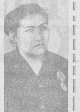
Жонажон Коммунистик партиясининг тарихий XXIV съездида иштирок этган шарафига муссаб бўлганини эслашга, қалбим олам-олам қувончларга тўлади.

СОВЕТ ИТТИФОҚИ КОММУНИСТИК ПАРТИЯСИ XXIV СЪЕЗДИНИНГ КПСС МАРКАЗИЙ КОМИТЕТИ ХИСОБОТ ДОКЛАДИ ЮЗАСИДАН РЕЗОЛЮЦИЯСИДАН