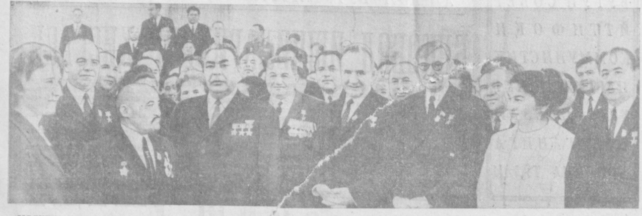
МОСКВА, 1971 йил, 6 апрель Совет Иттифоқи Коммунистик партияси ва Совет ҳукуматининг раҳбарлари КПСС XXIV съезди делегатлари орасида.

КПСС XXIV съезди партиянинг бундан буёнги вазифаларини, мамлакатимиз тараққиётининг истиқболларини кўрсатиб бергани ҳолда, экономика ва маданиятни юксалтириш, меҳнатқашларни фаровонлигини ошириш, социалистик демократияни ривожлантириш ва совет жамиятининг бирлигини мустаҳкамлашнинг аниқ ва равшан программасини, империализмга ва агрессияга қарши, тинчлик, демократия ва социализм учун изчил кураш олиб бориш программасини белгилаб беради. Съезд бу вазифалар партия ва халқнинг ғайрат-шижояти билан муваффақиятли суратда амалга оширилади, деб ишонч билдиради. Бизнинг планларимиз реал планлардир. Бу планларнинг бажарилиши ҳар биримизнинг меҳнатимизга, сабот, матонат ва маҳоратимизга, ушқоқчилигимизга ва интизомли бўлишимизга боғлиқдир.