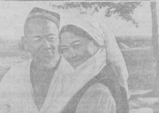
НАБИ РАҲИМОВ ўзбек кино санъатига ҳам улкан ҳисса қўшган санъаткордир. Улаб киноларда беш қаҳрамон ролларини ижро этди. Ҳар бири ўзига хос янги-янги характерлар яратди. Суратларда: СССР Халқ артисти Наби Раҳимов ижро этган кинофильмлардан кадрлар.