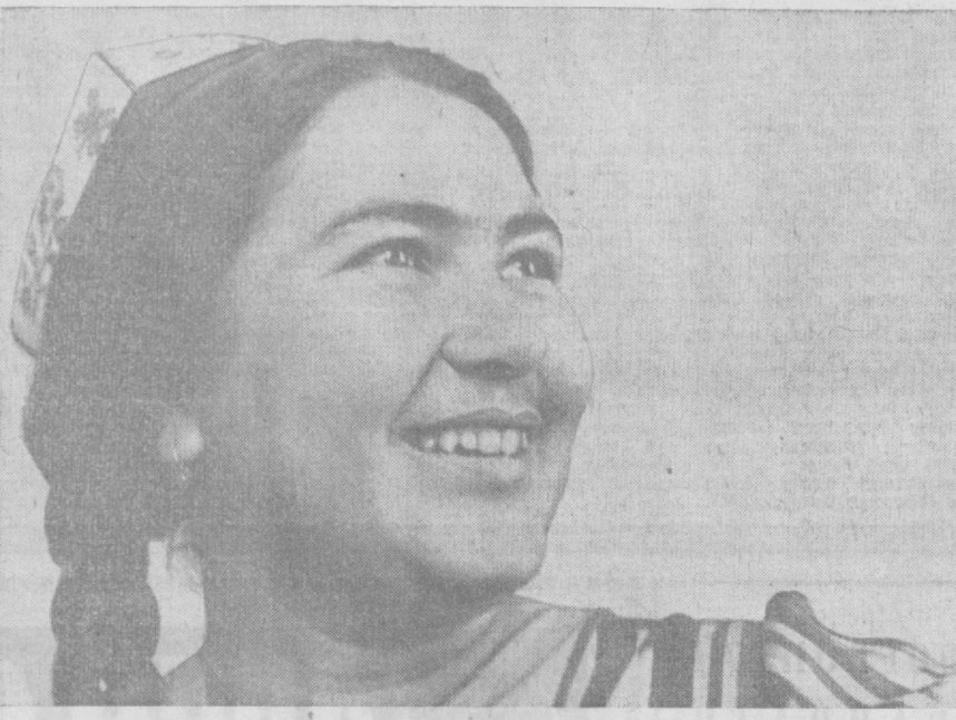
Қаранг, дўстлар, ўлкада қўлак, Баҳор акси чехраларда ҳам.

КОНЧИЛАРНИНГ Полярний, Надежий, Удачий, Айхал посёлқалари ўрғасида ширкат ширкати молиланган дастлабки қўлақ «ПАЗ-672» автобуслари қатнай бошланди.