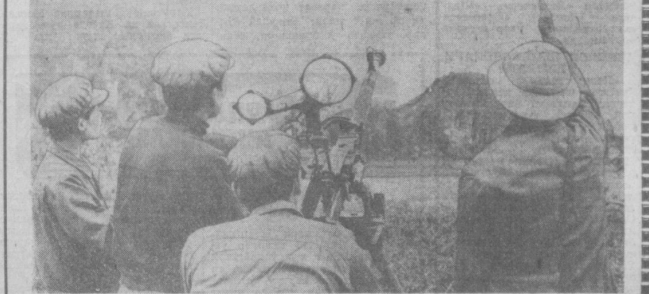
ВДР. Ҳа-ўзини ҳимоя қилиш қўнғилли зенит отряди Тханьхо вилотида мудофаада. Бу отряд ўрмонсозлик заводи ишчиларидан ташкил топган. Суратда: пулемет расчёти АҚШ ҳаво қароқчилари ҳужумини қайтарини таёёр бўлиб турибди.

«Майнити» газетаси ўзининг редакция мақоласида таъкидлашди, қуйидагиларни эсгади: Америка 7-флотининг ҳарбий кемалари, шу жумладан авианосецлари яқинда Токио кўрфазиди ҳарбий операциялар ўтказиш учун Япония портидида Иокояма базасидан шошилинч суратда чиқди. Америка деңиз шибда аскарлари бўлимлари ва қурувчи бомбардимончи самолётларининг аскадрьялари Япониядаги Иокояма базасидан Жанубий Вьетнамдаги Далап базасига кўчирди. Ана шу кўчирилларининг ҳаммаси Япония-Америка хавфсизлик шартномаси иқоби остида амалга оширилмоқда.