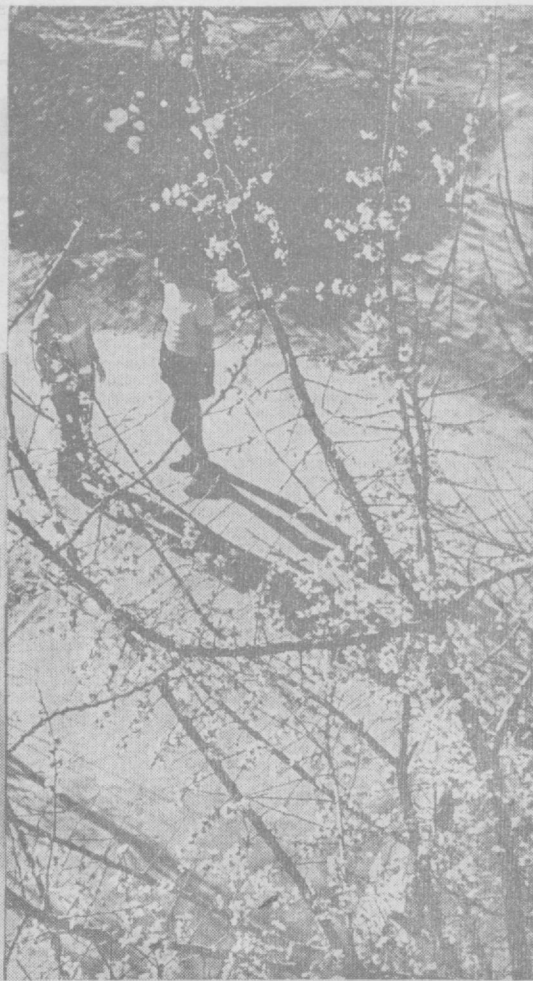
А. АБАЛҲАН фотоэтнодлари.