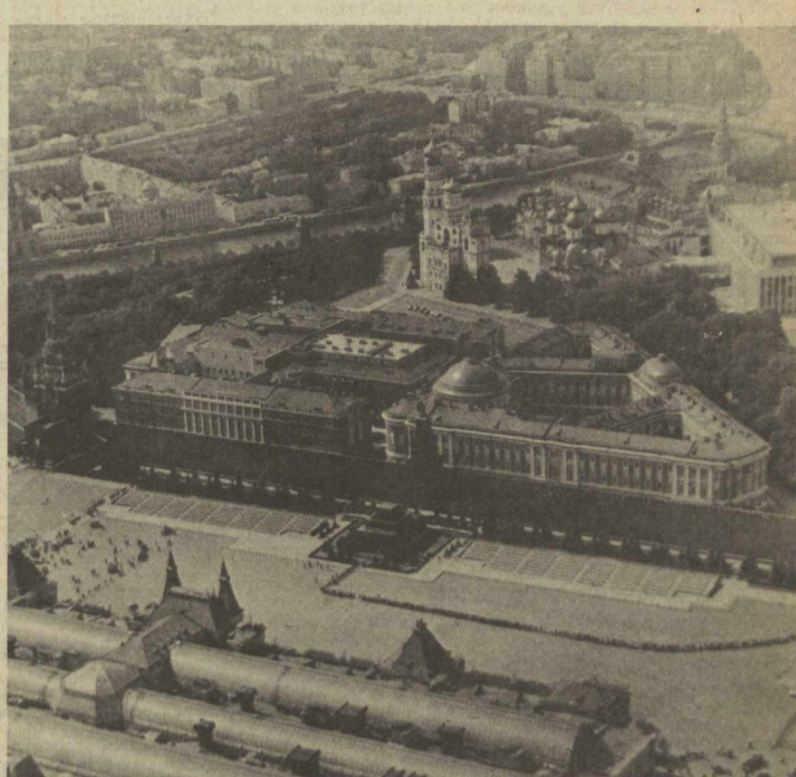
ҚИЗИЛ МАЙДОН ВА МОСКВА КРЕМЛИНИНГ ҚУРИНИШИ.