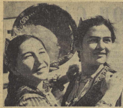
Тошкент шаҳар бадий бу... Тошкент шаҳар бадий бу... Тошкент шаҳар бадий бу...