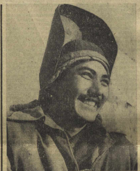
ҚИЯССР. «Ташкентгидроэнергострой» қурилиш бошқармаси коллективни Амударёнинг ўн соҳилида су тақсимлагич ишооти қурилишини муваффақиятли олиб бормоқда. У биттага, Амударё обихатини бирданга бешта канал бўйлаб оқиши имконияти тугилди. Коллектив ишоотини В. И. Ленин тугилган кунинг 110 йиллиғига тағуллаш мамбуриятини олган.

Майдонда келажакда 26 қаватли туристлар меҳмонхонаси, биринчи қаватда ёш келин ва қувалар учун мағазин жойлашадиган савдо уйи ҳам қурилади. Кино-концерт залининг қаршида жойлашадиган Халқлар дўстиғи хўжалик маъмузини ташиқ этади. Хайкалрош, СССР Давлат муражон жуда катта ишининг, миллионлаб ишчилар ва қолқозчилар, олимлар ва маданият арбоблари қилган фидоикорона меҳнатини самараларини Ўзбекистоннинг бугунги ривожига фарқлиб кўриб туришимиз. Сизларнинг ҳашаматли шаҳарларинингиз, эълонлаб парварши қилинган далапарчилик ва ашаб турган боғларинингиз қўриқ қилинган кўнгли қувонади. Обалекс