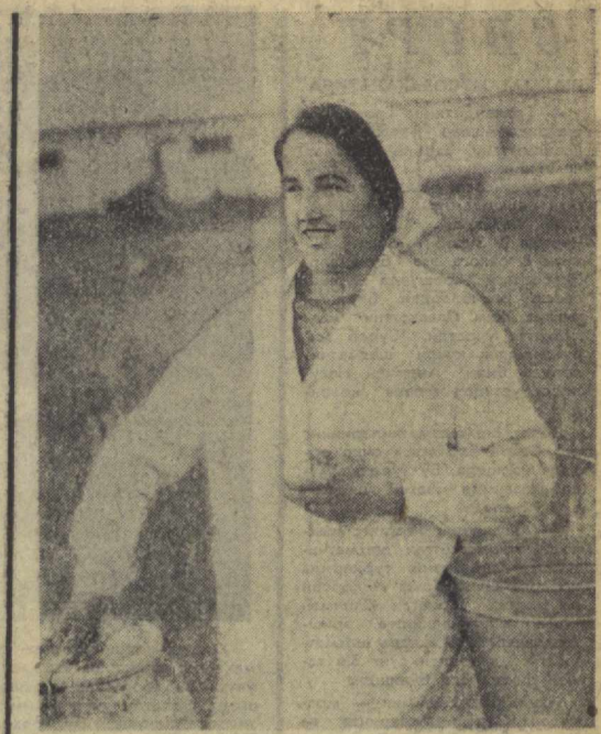
Хоразм области. Хива районидagi Фрунзе номи колхоз чорвадорлари янги йилни катта меҳнат галабалари билан кутиб олдилар...