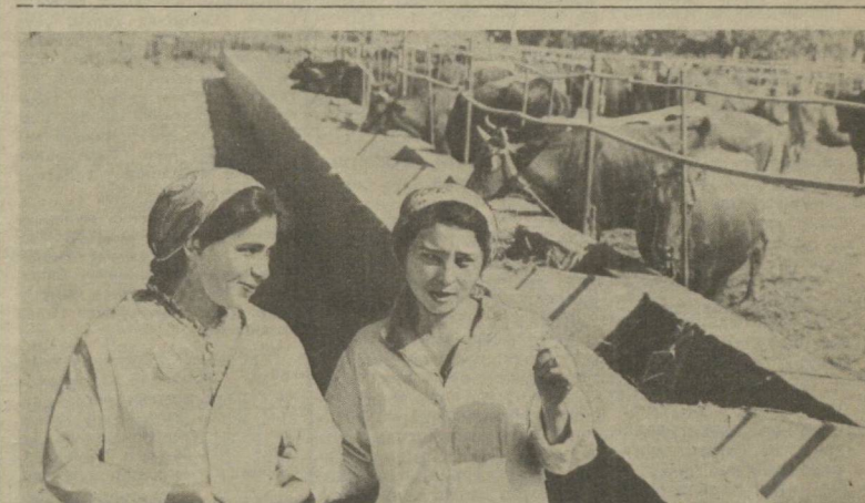
Хонқа райондаги «Октябрь 40 йилгил» колхозини чорвадорлари қишлоғга пухта тайёргарлик билан киришишга эди. Бу ерда молларни тўғимли рацион асосида озиклантириш учун етарли микдорда ем-хашак жамғарилган. Ферма бинолари ремонти сифати адо этилган. Шу тўғрисида хўжаликда қишлоқ даярида ҳам молларнинг махсулдорлиги юқори бўлиши таъминланмапти.