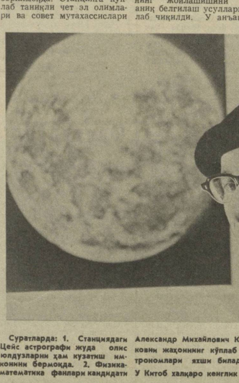
Александр Михайлович Калмыковни жаҳоннинг кўлаб астрономлари яхши биладилар...