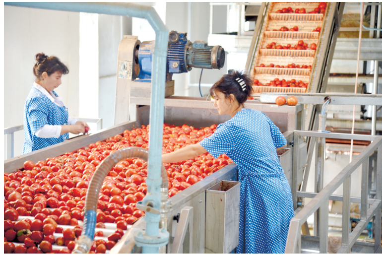
◀ (Давоми. Бошланиши 1-бетда).

Республикамиз аграр соҳа ходимларининг бугунги меҳнатлари замирида қишлоқ хўжалиги маҳсулотлари етиштиришни кўпайтириш орқали халқимизнинг озиқ-овқат хавфсизлигини таъминлаш, турмуш фаровонлигини ошириш, иқтисодий ёндашган ривожлантиришдек юксак вазифалар мужассам. Соҳа равнақига қаратилаётган эътибор, қишлоқ одамларига яратиб берилаётган муносиб меҳнат шароитлари туфайли ушбу эзгу мақсадга тўлиқ эришилмоқда. Бундай дейиш учун асосларимиз етарли, албатта. Масалан, 1990 йилда юртимиз аҳолисининг озиқ-овқат маҳсулотлари, жумладан, гўшт, сут ва қандолат маҳсулотларига бўлган эҳтиёжи, асосан, импорт ҳисобига қондирилган бўлса, бугунги кунда уларнинг деярли барчаси ўзимизда ишлаб чиқарилган маҳсулотлар эвазига қопланмоқда. Ўтган даврда аҳоли сони 11 миллиондан зиёд ўсганига қарамай, жон бошига гўшт истеъмоли 1,4 баробар, сут ва сут маҳсулотлари 1,5 карра, картошка 1,9 марта, сабзавот 2,6 баробардан зиёд, мева 6,3 марта ортгани кўп нарсани аниқлатади.