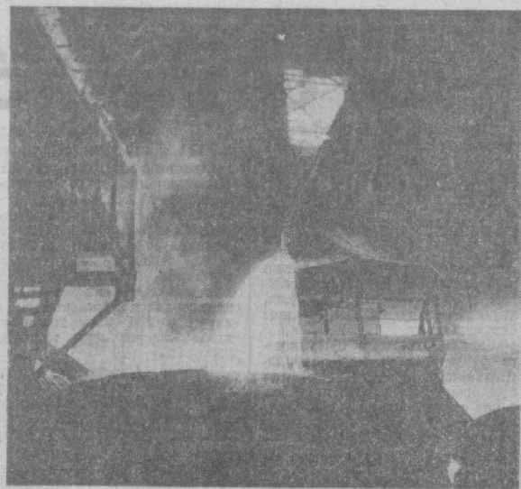
Мис заводи цехларининг бирида.

Я. САЛИМОВ, «Тошкент ҳақиқати»нинг маҳсул муҳбири.