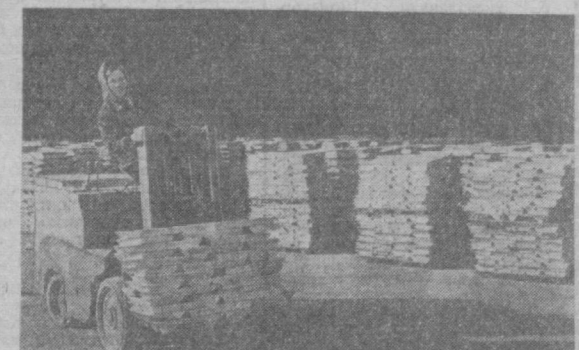
Олмалиқ минерал ўнгити ҳамда мисга талаб халқ ҳўжалигида яхшироқ каттади. Суратда, тайёр маҳсулотлар.

Аҳоли сонин ҳам бехўжот орттиб бermoқда. Қишлоқ ўринида шахар қурилиши янқ олдирлиб юборилган кезларда бу ерда бор-йўли 12 миң киши истиқомат қилган бўлса, ҳозир шахарликлар сонин 90 миңга яқинлашиб қолди. Олмалиқ аҳолиси ҳар йили ўрта ҳисобда тўрт миң кишига ортайпти.