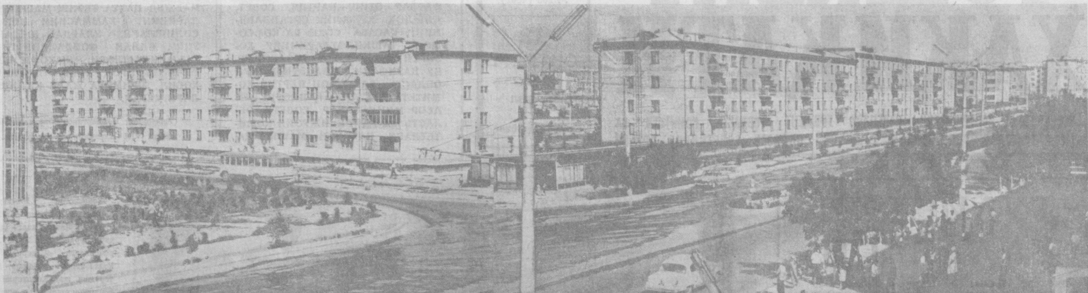
Бугуни Олмалиқ. В. И. Ленин номи проспекта.

— ОТА шаҳарни нега шундан аташди? Биз кирмаган кўчалар-у, боғлар қолмади, аймо айтарлиқ олмазорлар кўзга келмади.