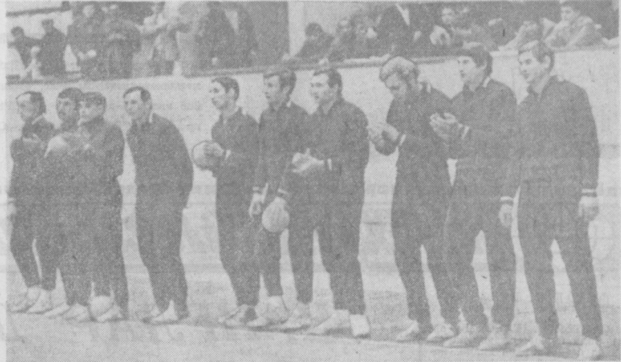
СССР биринчилиги учун Тошкентда ўтказилган кўл тўли мусобақаларида республикамиз пойтахтининг «Сиф» командасидан иштирок этмоқда. Суратда: «Сиф» командасининг аъзолари.

Гоҳи «озон» дўстларини ўйлаб, Холларидан ҳафа бўларди. «Шалларамай кет, — деб уқтирар, — Илгит бўлсам кўтар қаддингил!» Ким бу хилда мужмайиб юрар. Кўрайлик биз азму-ҳаддингилни. Тортар эди уни даврага, Боглар эди белига белбоқ. Бошлариди кураш ўртада, Топиларди «рақиб» ҳам шу чоқ. Сайларини қизитиб шу хил, Ном олди у элда, пахлавон. Спорт билан шуғулланган дил, Бўлар элда у марди-майдон. НАЗАРМАТ.