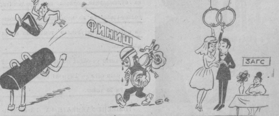
Жуда «асов» экан... Ниҳоят, маррага келди. Гимнастикачилар ниҳодан ўтпти. М. ВОРОВБИЧКОВ чизган расмлар.