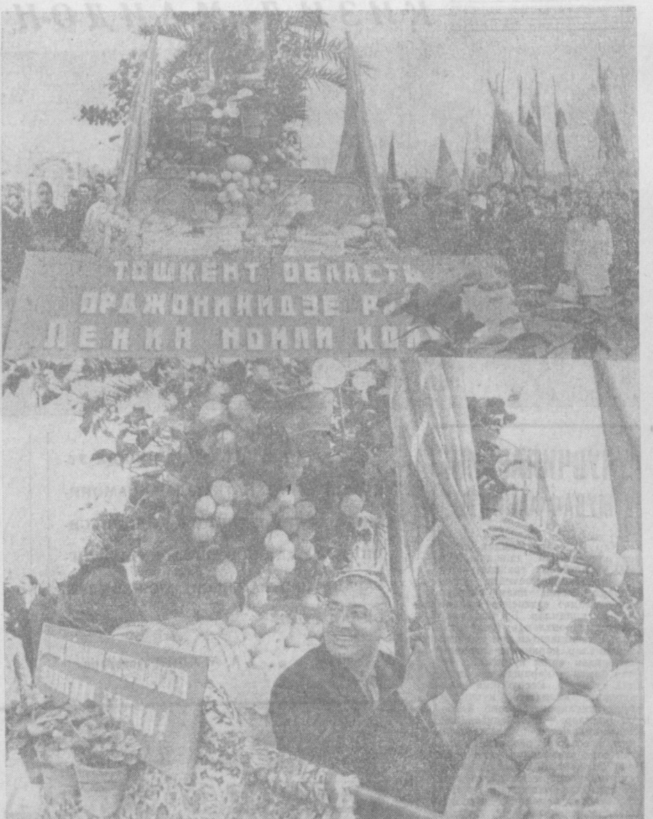
В. И. Ленин номи майдондан меҳнаткашлар намойиши пайтида Оржоникидзе районидаги Ленин номи колхоз сабаветкорлари колоннаси улуғ айёмни муносиб меҳнат совғалари билан кутиб олганини кўрсатди.

ОБЛАСТИМИЗНИНГ Газалкент, Пискент, Азимкент шаҳарлари ва бошқа районларида ҳам меҳнаткашларнинг намойишлари бўлиб ўтди. Эрта тонгда бошланган байрам шодидеялари кеч тунгача давом этди.