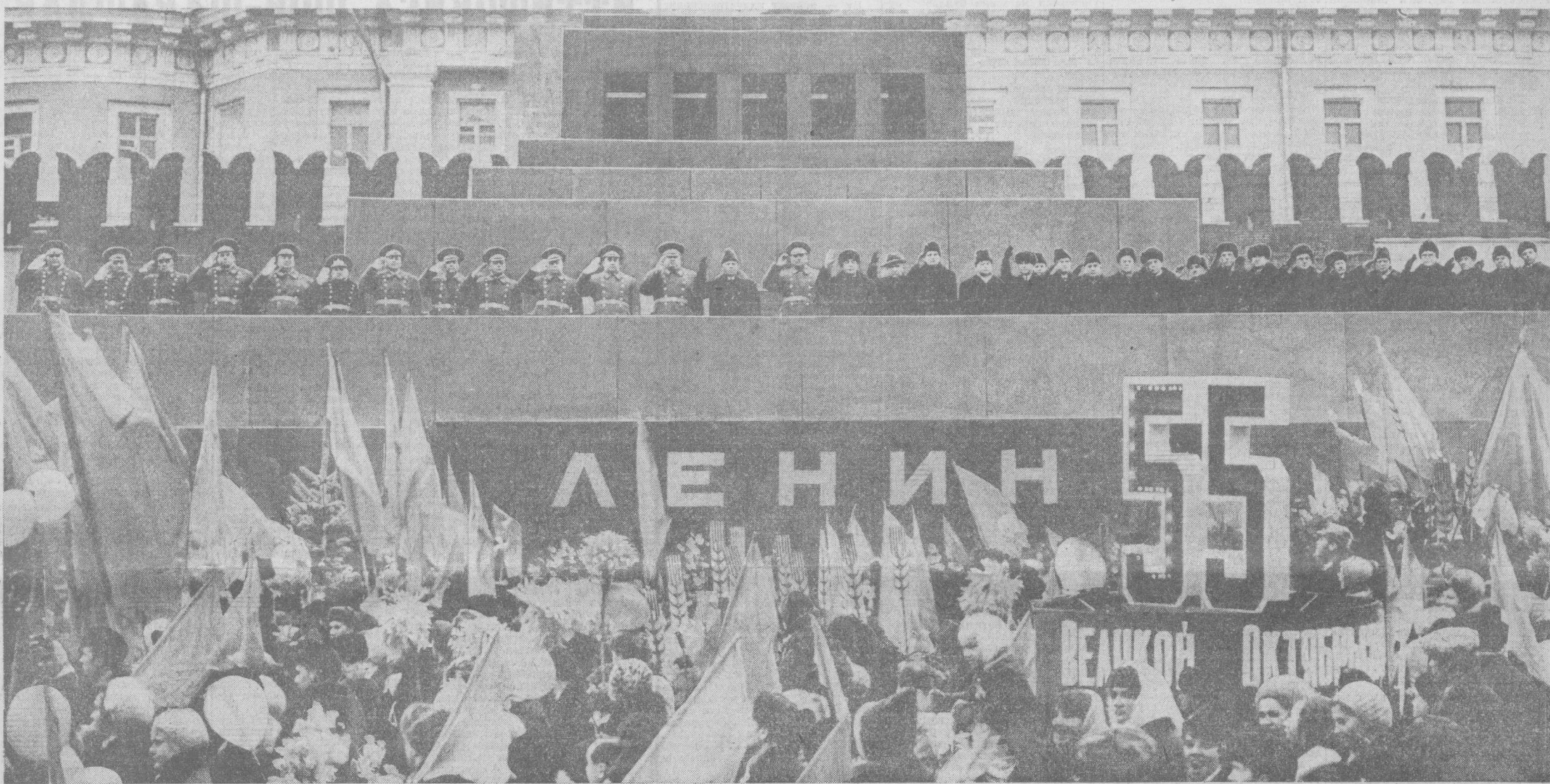
МОСКВА. ҚИЗИЛ МАЙДОН. 1972 ЙИЛ 7 НОВАБРЬ.

БАЙРАМ ТАНТАНАЛАРИ ПАРТИЯ ВА ХАЛҚНИНГ БУЗИЛМАС БУЮК БИРЛИГИНИ, СОВЕТ КИШИЛАРИ КПСС XXIV СЪЕЗДИ ТАРИХИЙ ҚАРОРЛАРИНИ ШАРАФ БИЛАН БАЖАРИШ УЧУН ҚАТЪИЙ АҲДУ-ПАЙМОН ҚИЛГАНЛИКЛАРИНИ ЯНА БИР МАРТА НАМОЙИШ ЭТДИ.