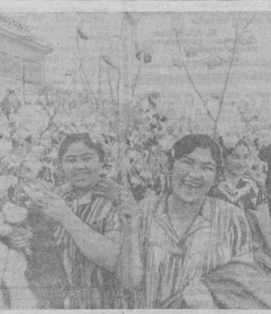
В. И. Ленин номи майдонда меҳнаткашлар намойиши.

САНТЬЯГО. (ТАСС). Чили ички ишлар министри Карлос Прайснинг мабурут учун берган баёнотида шу нарса таъкидланди, ҳукумат юк машиналари ағдарли, майда савдогарлар ва корхона ағдарлининг ҳамон давом этаётган ҳамда Чилида экономика ва мамлакат аҳолисини катта зарар етказиб қолганлигини таъкидлади. Шу маъсадда, дейилди ҳужжатда, забастовка катталарининг вакиллари билан яна музокаралар бошланди. Музокараларни ички ишлар, молия, экономика, ривожланиш ва реконструкция министрлари билан корхона ағдарли қасаба союзи бирлашмаларининг раҳбарлари олиб бормоқдалар.