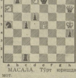
МАСАЛА. Тўрт юришда мат.