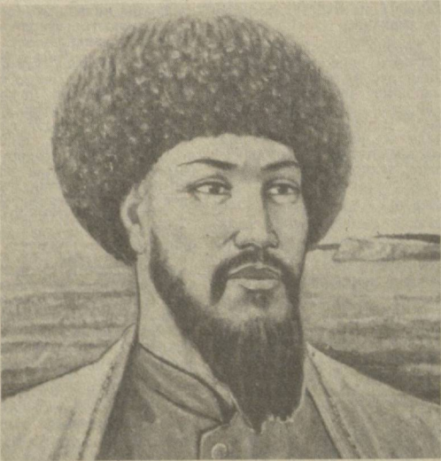
Тарихнинг бир сабоғи шундайки, айрим халқ ёки миллат қанчалик қолоқ ёки тарақлий ётган бўлмасин...