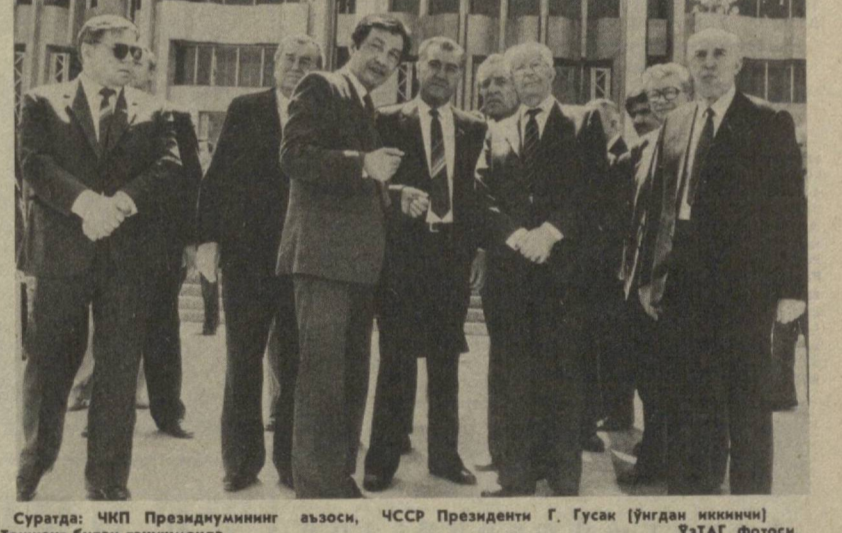
Суратда: ЧКП Президиумининг аъзоси, ЧССР Президенти Г. Гусак (ўнган иккинчи) Тошкент билан танишмоқда.

Чехословакияда қурол-ланиш поғасини тўхтатиш, ялти тинчлик ва хавфсиз-ликни мустаҳкамлаш йўлида Совет Иттифоқи зўр бериб сарфлаётган куч-ғайратлар жуда кенг миёсда қўллаб-қувватланмоқда, деб таъкид-лади Г. Гусак. Умуевропа хонадон госяни қўйидаги барча халқларнинг тинч, ялти қўшнлиқини ва кенг ҳамкорлиги госяни чехосло-вак халқига айлиқса азиз-дир. М. С. Горбачев ЧКП Мар-