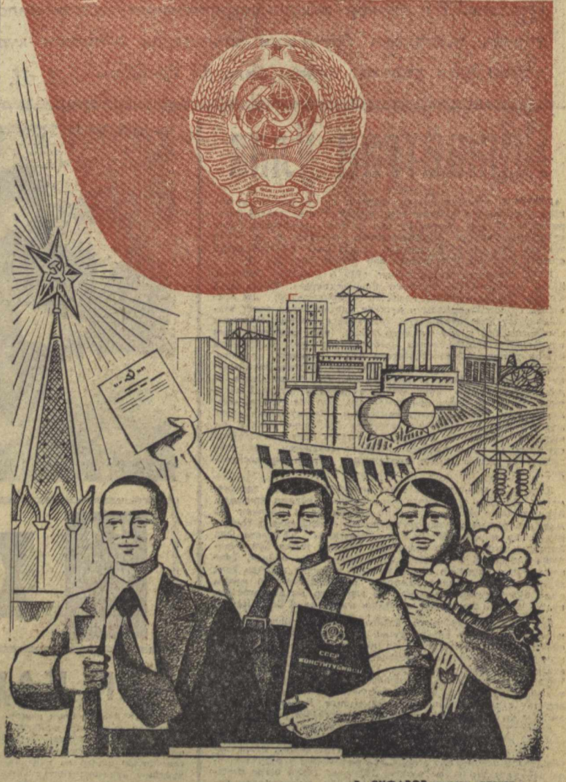
Р. ЗУФАРОВ чизган плакат.

Учқўрғон районидagi Ленин номи колхозининг ерлари қўзғилиб кетган тоғли Норин дарёсининг соҳилида машина-механизмлар қийради. Бу ерда сершал майдонлар узлаштирили бошланди. Бу ерда ҳар кунини мийт кубометрдан кўпроқ унум тупроқ ташиб келтирилмоқда. Бу ишнинг колхоз