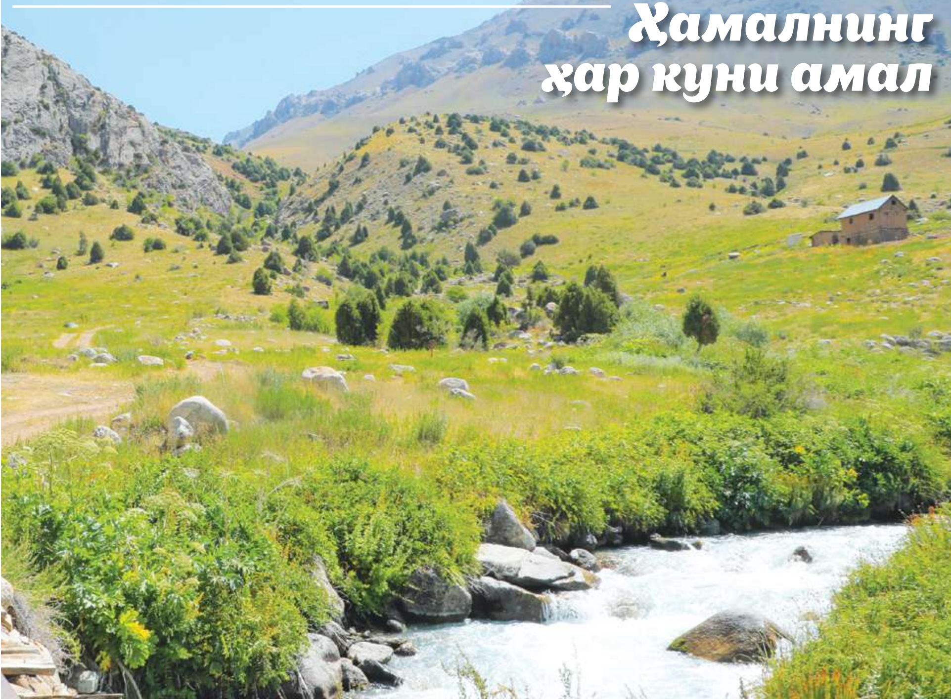
СУРАТДА: Қашқадарё вилояти Шаҳрисабз туманидаги Филон қишлоғи манзараси