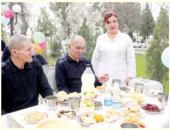
Фаргона вилояти Эзгулик