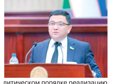
Иномжон КУДРАТОВ, депутат Законодательной палаты Олий Мажлиса, член фракции Социал-демократической партии Узбекистана «Адоллат».

ственных сооружений, совершенствованию законодательной базы в данном направлении. До 2018 года площади внедрения водосберегающих технологий в республике составляли 28 тысяч гектаров, сегодня переводой метод используется на 1,2 миллиона гектаров, или 28 процента орошаемых земель.