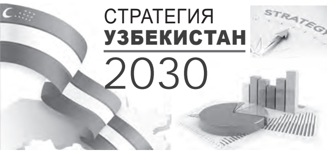
Стратегия Узбекистан 2030

Конкретные и прагматичные действия и перспективные планы Узбекистана по региональному сотрудничеству являются движущей силой этих процессов. Сегодня граждане соседних стран приезжают в Узбекистан повидаться с родственниками, получить высшее образование, вести торговые дела и развивать предпринимательство.