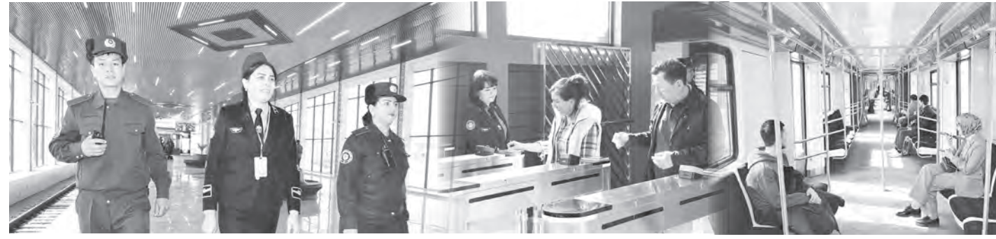
Окончание. Начало на 1-й стр.

Лет пять-шесть назад, когда говорили о надземном метро, многие не понимали, как оно работает. А те, кто знал, вспоминали увиденное за границей. Согласно постановлению Президента «О мерах по реализации проекта «Строительство кольцевой надземной линии метрополитена в городе Ташкенте» от 19 мая 2017 года, была начата реализация огромного и исторического проекта, не наблюдавшегося в транспортной системе нашей страны.