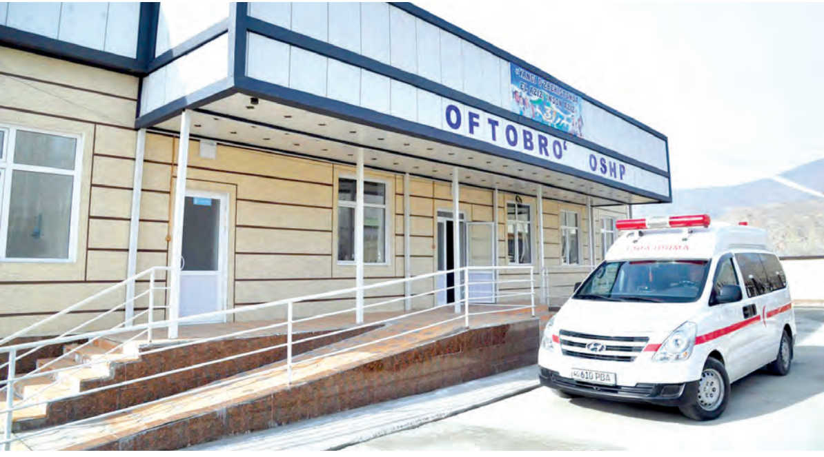
«Окончание. Начало на 1-й стр.»

- Сегодня нет надобности ехать в областной центр, - ответил Боборован. - В Сохе построили современную клинику, ничем не отличающуюся от городских. Отремонтированы и переоснащены все больницы и врачебные пункты. В медучреждениях созданы отличные условия, работают квалифицированные врачи, которыми довольно население Соха... А в гости обязательно приедем, как только потеплеет.