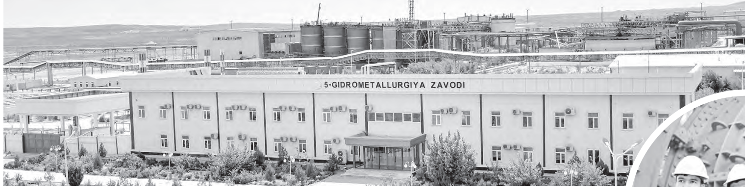
«Окончание. Начало на 1-й стр.»

В рамках разработанной специалистами комбината и международной консалтинговой компании Boston Consulting Group (BCG) стратегии цифровой трансформации на 2023-2030 годы планируется реализовать работы по 12 направлениям: управление горными работами; цифровая гидрометаллургия; единая горно-геологическая система; единая система технического обслуживания и ремонта. Комбинат планирует внедрить 116 современных цифровых решений. Это поможет решить широкий спектр задач. Во-первых, повысить эффективность производственно-технологических процессов и сократить затраты. Во-вторых, увеличить приспособляемость производства. Гибкость создает конкурентное преимущество предприятия, повышает качество работы. В-третьих, снизить влияние человеческого фактора.