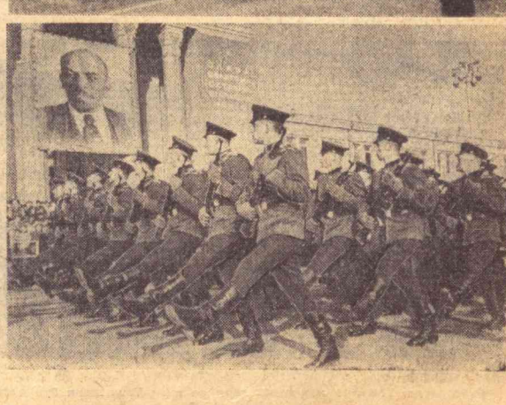
1966 йил, 7 ноябрь. Тошкент. Суратда. Ҳарбий парад. И. Глауберзон фотоси.