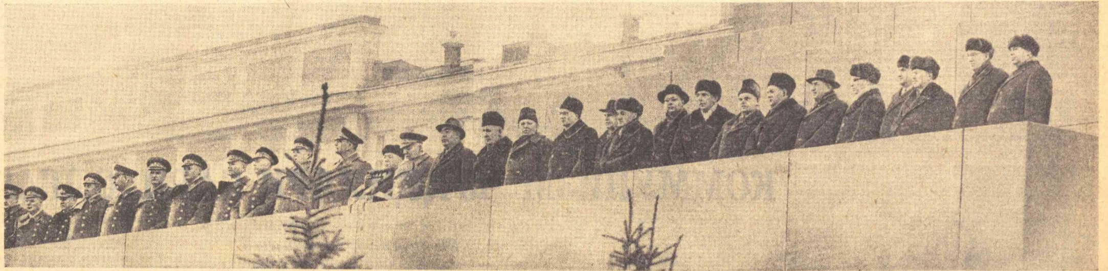
Москва. Қизил майдон. 1966 йил 7 ноябрь. Партия ва ҳукумат раҳбарлари В. И. Ленин Мавзолеи минбариди.

ССР Иттифоқи Министрлар Совети ва ВЦСПСнинг кўча Қизил байроғи ва биринчи даражали пул мукофоти «Усельхозтехника» Пахтаорол район бirlашмасига, СССР Министрлар Совети хўзуридаги Бутуниттифоқ «Союзсельхозтехника» бirlашмаси ва қишлоқ хўжалиги ҳамда тайёрлов орталари шочи ва хизматчилари қасаба союзи Марказий Комитетининг