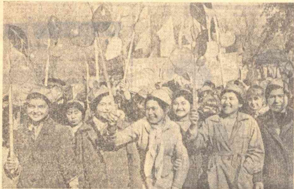
Тошкент меҳнатчиларининг намоиши.