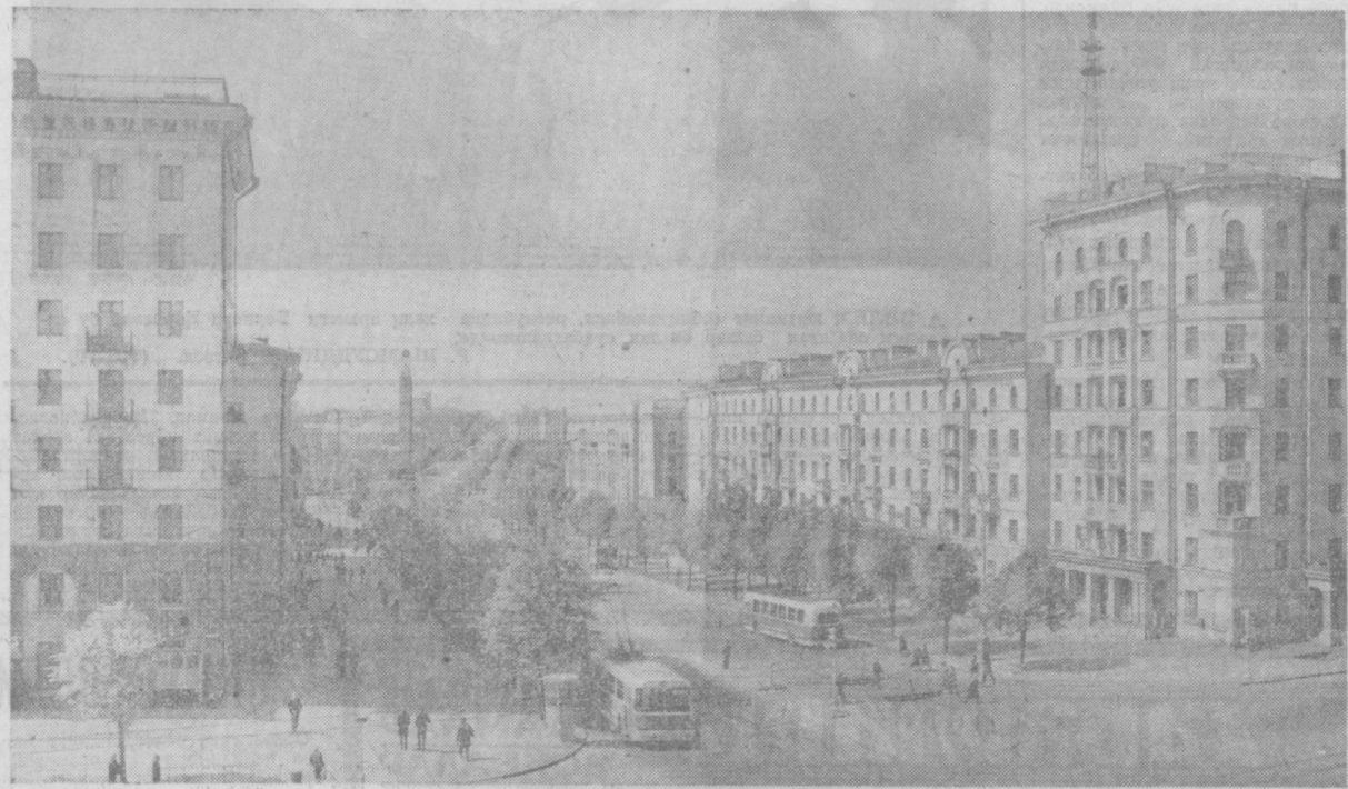
● МИНСК — Беларуссия ССР пайтахти. Суратда: Ленин проспектининг узумий кўриниши.

умид боғлаган эдилар. Ленин душман жуда қаттиқ янглишти. Коммунистик партиянинг даъвати биноан ўз социалистик Ватани — улуг Совет Иттифоқини ҳимоя қилишга қўтарилган барча социалистик миллатлар душман бўлига тош метиндек девор бўлиб туриб олдилар. Ҳар бир ҳарбий қисмда ва ҳар бир партизан отрядида СССРдаги ҳамма миллатларнинг ўғил ва қизлари бўлган жангчилар билан командирлар бошчилигида қарши бекдан бош чиқариб мардонавор жанг қилдилар. Тинчлик меҳнат фронтда ҳам бизнинг қўларимиз қардошларча дўстларимиз туғайли урушнинг оғир жароҳатларини тез тузатишга му-