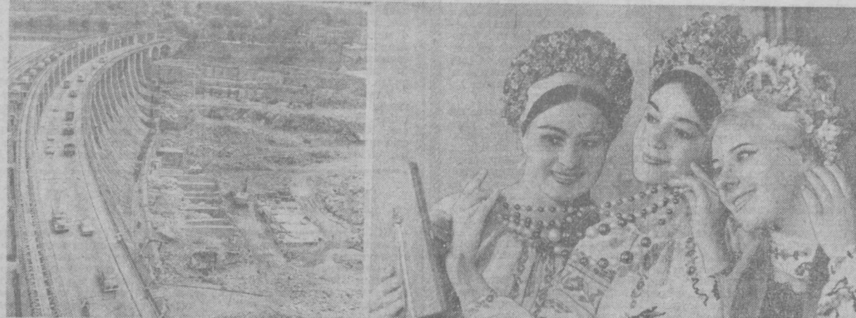
▲ СУРАТЛАРДА: 1. В. И. Ленин номидидаги Днепровск гидроэлектр станциясининг умумий курилиши. Шу йил 10 октябрда бу йirik нур илмоотининг биринчи санат токи бера боқаланига 40 йил тўлди. Ҳозир ГЭС қайта тугилмоқда. ДнепротЭС-2 бунёд этилмоқда. 2. Бу қуввоқ қизлар Янгомир «Льон» хореография ансамблининг солистлари. Бу талантли коллектив бутун мамлакатимизга яхши танилган.

Коммунистик партия, Совет ҳўкимияти, социалистик тузум тарбиялаб ўстирган ажойиб ил-