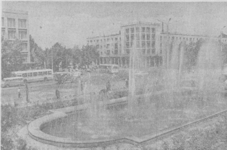
ТОЖИКИСТОН ССР пойтахти — Душанба. Ленин проспекти.

Уттизинчи йилларнинг бошларида Вахш водийси ўзлаштирила бошланди. Чет эл мутахассислари ва вакиллари рўбба чинамайдиغان ҳаёлини бир йарса, деҳ қисоблаган эдилар. Аммо улар партиямиз халқини оммавий меҳнат қарамонлигини руҳида тарбиялаганини ҳиссига олмадилар. Ҳаёлини бир йарсаини ҳақиқатга айналтирмоқ учун улар йил талаб қилишди. Қалин қамшизорлар, шўрликлар ва боққоқликлар барҳам топди. Бухоро амири Вахш водийсини одамлар