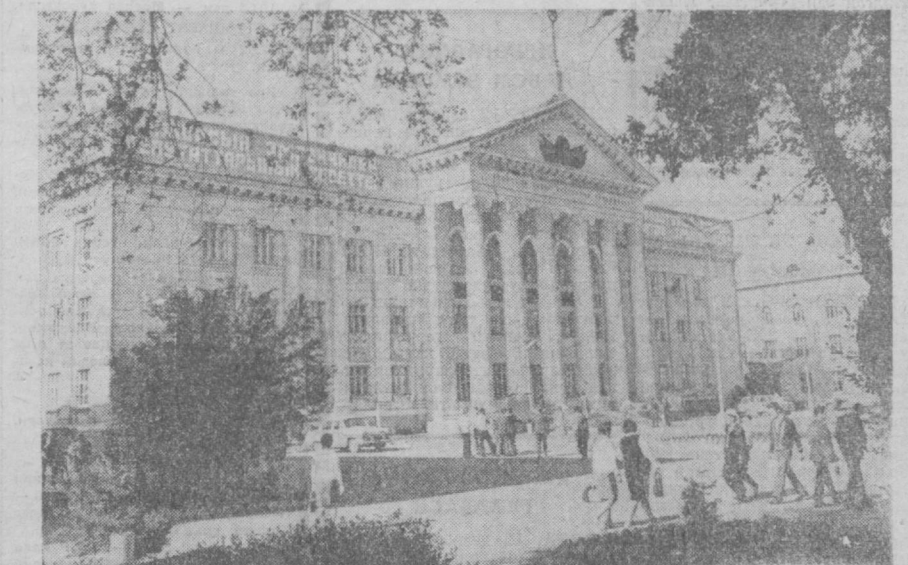
ҚИРҒИЗИСТОН ССР. Республика пойтахти — Фрунзе Иттифоқдаги энг замонавий ва сўли шаҳарлардан бири. Суратда: Фрунзе шаҳар икромия комитетининг биноси.

Ҳозирги Қирғизистон — Елпасига саводхонлар ўлкасидир. Ҳар бир қишлоқ, ҳар бир овулда мактаблар ташкил этилган. Бу мактабларда қирғиз, рус тилларида ва бошқа баъзи тилларда дарс беришмоқда.