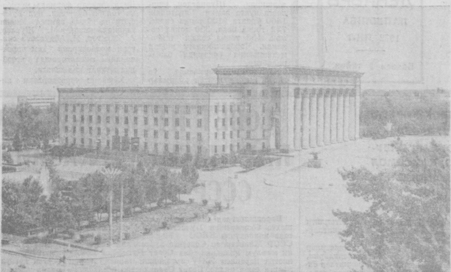
ҚОЗОҒИСТОН ССРнинг пойтахти — Олмаота. Қозоғистон Компартияси Марказий Комитети ва Министрлар Советининг биноси.

хўжалиги ҳамда маданиятининг ҳамма соҳаларини мавж уриб юксалтириш таъминлаш мумкин бўлди. Туркистон — Сибирь темир йўлининг қурилиши совет халқларининг бир ёқадан бош чиқариб ҳаракат қилганликларини кўрсатувчи ёрқин намуна бўлди. Биринчи беш йилликдаёқ ана шу темир йўл магистралини бутун мамлакат кўрди. Қурилишда қозоғистонликлар билан биргаликда Россия Федерацияси, Украина, Белоруссия ва бошқа республикаларнинг қўлига биноқорлари меҳнат қилдилар. Ҳозирги кунда Қозоғистон ССР саноати 1940 йилдаги нисбатан 20 баравар ва революциядан илгарини даврга нисбатан 158 баравар зўрроқ маҳсулот ишлаб чиқармоқда. Қозоғистон саноати энг янги техника билан таъминланди, қора ва раптан металлургия, химия ва машинасозлик саноати, энгил саноат ва озиқ-ов