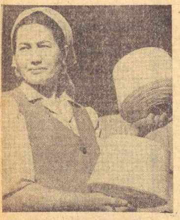
Тураҳона ана тўқимачилик комбинатидеги экилтиришчи. У тайيارлаган калава доим юқори сортли, пишқи ва силқи. У бир смненде «М-150» маркали йигирув машинасида 140—150 та калава ип олади.

Туркманистон Компартияси Марказий Комитети, Туркманистон ССР Олий Совети Президиуми ва Министрлар Совети Ўзбекистон Компартияси Марказий Комитети, республика Олий Совети Президиуми ва ҳукуматига қўллаган мантубида турман адабиети ва санъатининг Ўзбекистонда ўтказилган давдадаси қатнашчиларинингизни ва самимий ташаккур билан Туркманистондаги имедий сонолар ҳамда бадий коллентивларининг меҳнатига юксак баҳо берганиликлари учун республиканинг барча меҳнатқашлари номидан бутун қардош узбек халқига қизгин ташаккур изхор қилди.