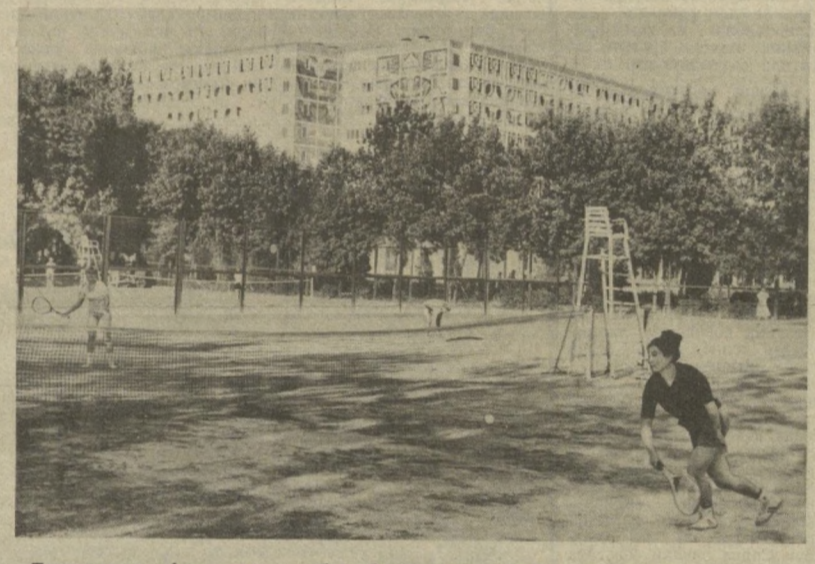
Тошкентдаги Авнасозлар шаҳарчасида фойдаланишга топширилган «Антей» кооператив спорт-соғломлаштириш маркази кўнгликка маъмул келмоқда. Бу ерда жисмоний тарбия билан шуғулланиб, саломатлигини мустаҳкамлаш учун барча шароитлар яратилган. Суратларда: теннис май-