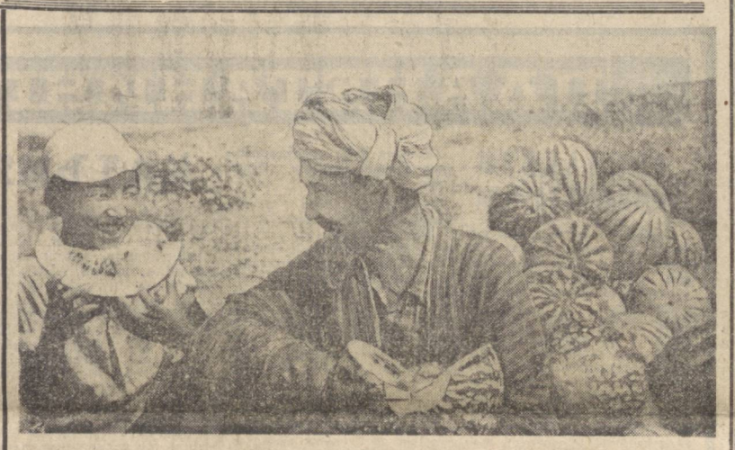
Шеробад районидagi «Оштор» 60 йиллиги совхозда бу йил таровдан мўл ҳосил етиштирилди...