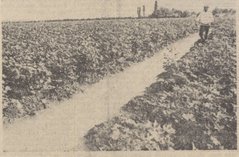
ТОШКЕНТ ОБЛАСТИ. Коммунистик районидеги «Прада» колхозининг Шин Тя Рен бонлиқ 10-бригадаси аъзолари 83 гектар пахта майдонининг ҳар гектаридан 50 центнердан «оқ олтин» йиғиб-териб олишга суз берганлар...