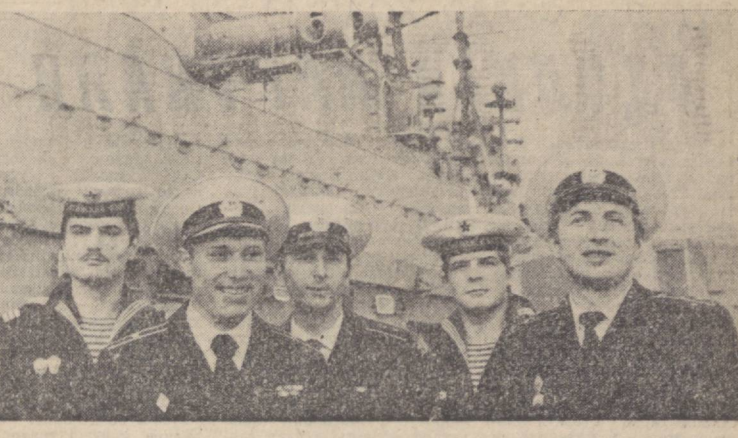
26 ИЮЛЬ — ХАРБИЙ-ДЕНГИЗ ФЛОТИ КУНИ

латлараро алоқа тили бўлиши рус тилида ўқиш мумкин. Бундай баъдий таржима билан шуғулланиётган адибларнинг шу жумладан талабқон ёзувчи ва таржимон Сергей Петрович Бородиннинг ҳам хизмати бор, албатта. Унинг номи билан аталган мукофот СССР халқлари тилидан ўзбек тилига ва ўзбек тилидан рус тилига қилинган энг яхши таржималар учун берилади.