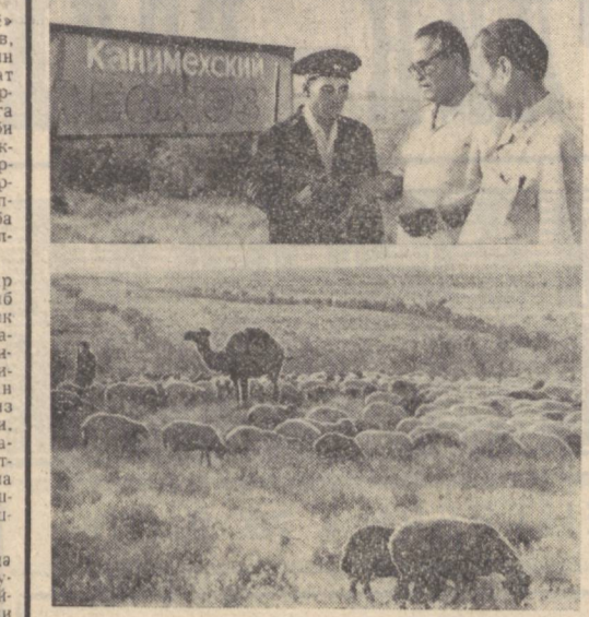
Чўл-биёбонларнинг яшил ихотаси