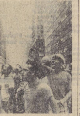
Яқинда Нью-Йоркда бўлган манифестация қатнашчилари...