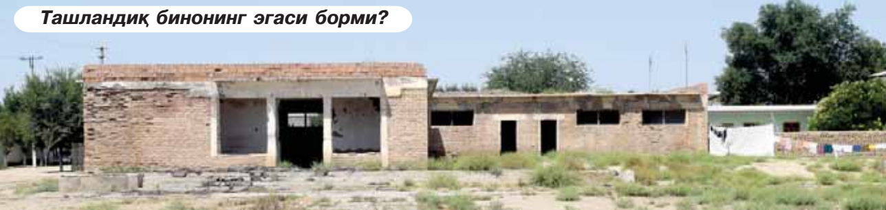
Ташландиқ бинонинг эгаси борми?

узилиш бўлган вақтда эса ичимлик суви муаммоси янада оғирлашади. Афсусланарлиси, Нурафшон маҳал-ласи экинзорлар ўртасида жойлаш-ган бўлса-да, оқар сув билан ҳам таъминланмаган. Қишлоқ кишилари-нинг айтишича, томорқаларидаги да-рахт ва бошқа экинларни челақда сув ташиб суғоришар экан. Нурафшонликлар «Обод қишлоқ»