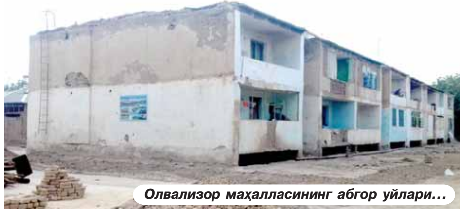
Олвализор маҳалласининг абгор уйлари...

ишлар аҳоли зиммасига юкланаётгани ҳамда қурилмиш-таъмирлаш ишларини бажариш учун хонадон соҳиблари кредит олишга мажбурланаётганини айтишди. Хусусан, кўп қаватли уйларнинг том қисмини янгилаш учун ҳар бир хонадон ҳисобига кредит олиниши шарт қилиб қўйилмоқда. Бунга рози бўлганлар бор. Аммо яшовчиларнинг аксарияти эҳтиж-манд оилалар, ногиронлиги бор киши-лар эканлиги эътиборга олинса, уларга бу борада яна қийинчилик туғилмайдими?