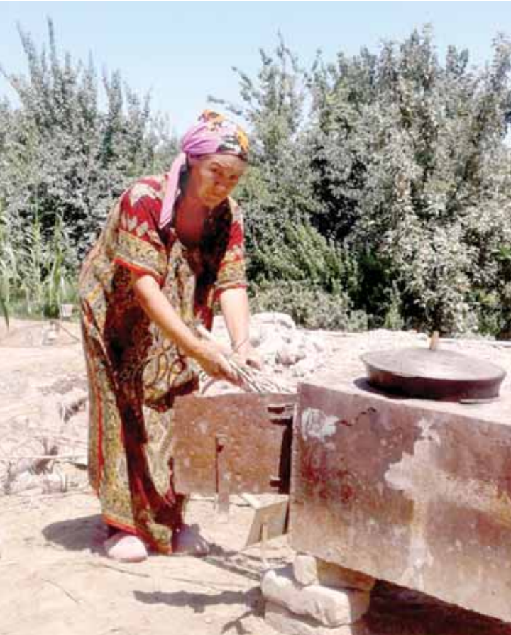
Бу ўтмишдан лавҳа эмас, Чолиш қишлоғининг бугунги куни.

дастури ижросидан ана шу ва бошқа муаммолар ечимини кутиш-моқда. Қишлоқларнинг обод ҳамда кўркам бўлишига катта умид билан қараган ҳолда, ободонлаштириш ишларида ўзлари ҳам ҳамжиҳатлик билан қатнашишларини айтишмоқ-да. Уйлаймики, дастур ижросига масъул ташкилот ва раҳбарлар Мирзаободдаги мазкур маҳаллада олиб борилаётган «Обод қишлоқ» дастури ижросини тезлаштириш бо-расида янада аниқ чора-тадбирлар-ни белгилаб оладилар.