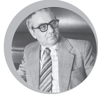
Asqad MUXTOR, O'zbekiston xalq yozuvchisi

Qonga – qon! Jonga – jon! Bermaymiz omon, Odamxo'rlar bo'lar yer bilan yakson, Chunki er yigitlar senga posbon, Senikidir zafar, Vatanim, jonim, Davlatim, savlatim, shavkatim, shonim, O'lsam ayrilmasman quchoqlaringdan.