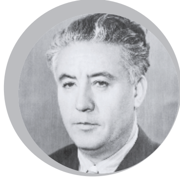
UYG'UN, O'zbekiston xalq shoiri

Xalqim etagida yetdim voyaga, Xalq bilan kuldim. Bardoshim so'z bermas, deyman, qoyaga... Roziman, o'lguncha xalqim deb o'ldim.