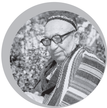
MIRTEMIR, O'zbekiston xalq shoiri

Ona-Vatan uchun boshlar bo'lsak jang, Yov Vatan postida poymol bir chang.