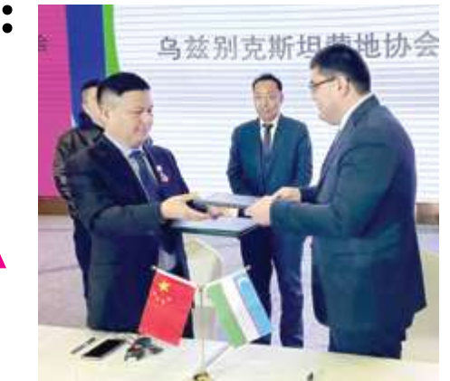
Узбекистон Халқаро форумда

Таъкидлаш жоиз, Ўзбекистон касба уюшмалари Федерацияси кўп йиллардан буён ўз тасарруфидаги оромгоҳлар ва соғломлаштириш марказларини жаҳон андозалари асо-