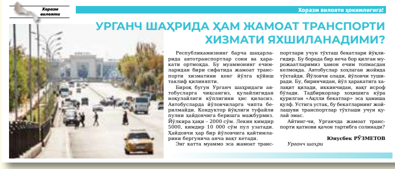
Хоразм вилояти ҳўналигини Урганч шаҳрида ҳам жамоат транспорт хизмати яхшиланадими?

«Ishonch» gazetасининг 2024 йил 5 мартдаги 30-сонида чоп этилган «Ҳар бир мурожаат ортида инсон дарди бор...» сарлавҳали мақолада «Ishonch» ва «Ishonch-Доверие» газеталарининг 2023 йилдаги мурожаатларини эътиборсиз қолдирган давлат идоралари ва ташкилотлар рўйхати эълон қилинган эди. Уларда келтирилган ҳолатлар юзасидан Қурилиш ва уй-жой коммунал хўжалиги вазирлигидан қуйидаги мазмунда жавоб хати келди: