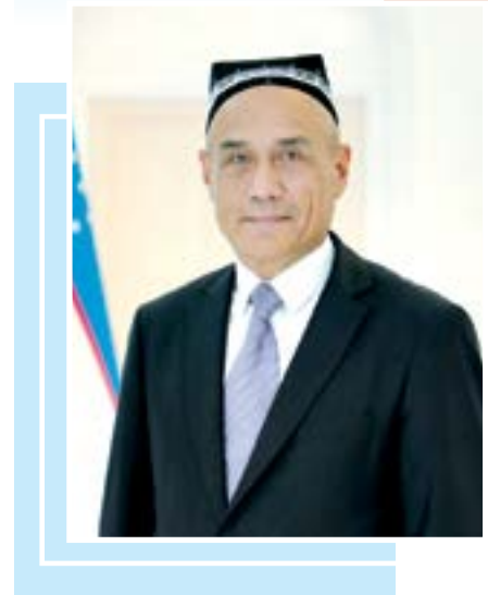
Шуҳрат СИРОЖИДИНОВ, Алишер Навоий номидаги Тошкент давлат ўзбек тили ва адабиёти университети ректори, академик

этиладиган масканда Фанлар академияси хузуридаги адабиёт музейи, Алишер Навоий номидаги ихтисослаштирилган ижод мактаби, Алишер Навоий халқаро фонди, Фанлар академияси Ўзбек тили, адабиёти ва фольклори институти, Мақом маркази жойлаштирилади. Шу жиҳатдан мазкур мажмуа ўзбек халқи қадриятларини, маданиятини, тилини Алишер Навоий сиймоси орқали дунёга кўрсатувчи ажиб бир зиё маскани бўлади.