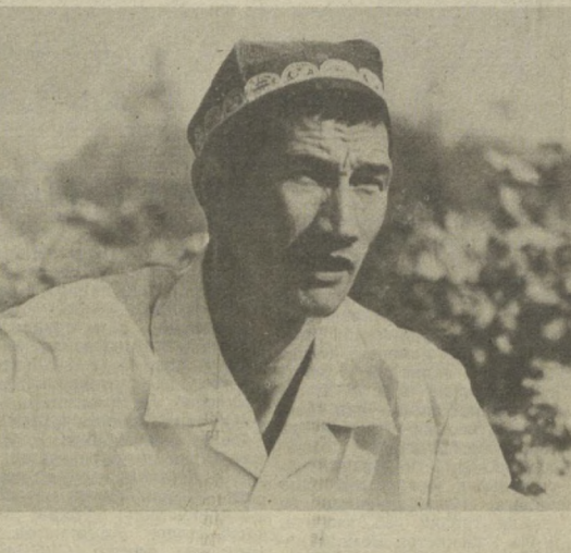
Жомбой районидagi «Коммунизм» колхозида пахта терими қизгин олиб боришмоқда. Айниқса, хўжалигининг 12-бригадаси аъзолари теримда пешқадамлик қилишадир. Улар мавжуд 66 гектар майдоннинг ҳар гек-

● Далада ишлаётганлар ҳақида гапмуҳурлик — шу кунининг муҳим вазифаси!