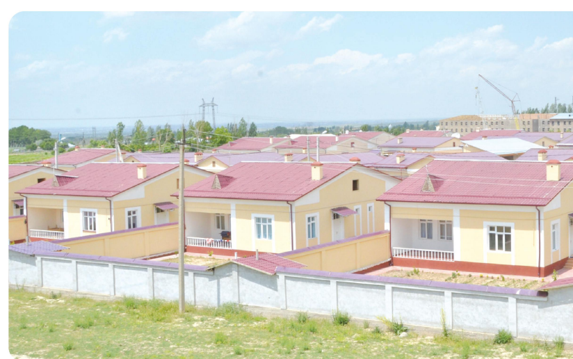
Бугунги кунда юртимизнинг барча ҳудудларида, хусусан, қишлоқ жойларда ҳам аҳолининг фаровон турмуш кечирishi учун зарур барча шарт-шароит яратилмоқда.

Жорий йилда биргина Сирдарё вилоятининг ўзида қурилиши ниҳоясига етказилган 320 та намунали лойиҳадаги янги уй-жойларни ҳам шулар қаторига киритиш мумкин.