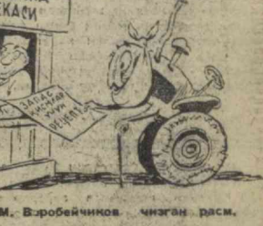
М. Вәробеичиков чизган расм.